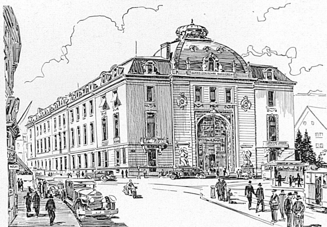
Bankgebäude in Zürich — Hôtel de la banque à Zurich