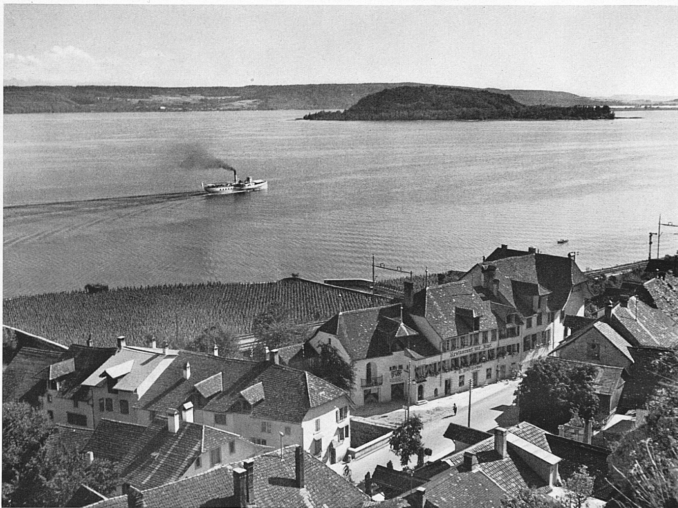
Douanne, le lac de Bièvre et l'Île St-Pierre. Twann, der Bielersee und die Petersinsel.*