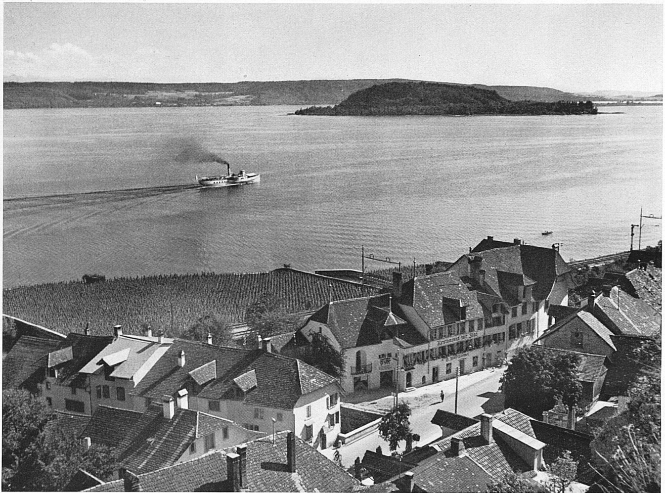
Douanne, le lac de Bienne et l'Ile St-Pierre. Twann, der Bielersee und die Petersinsel.*