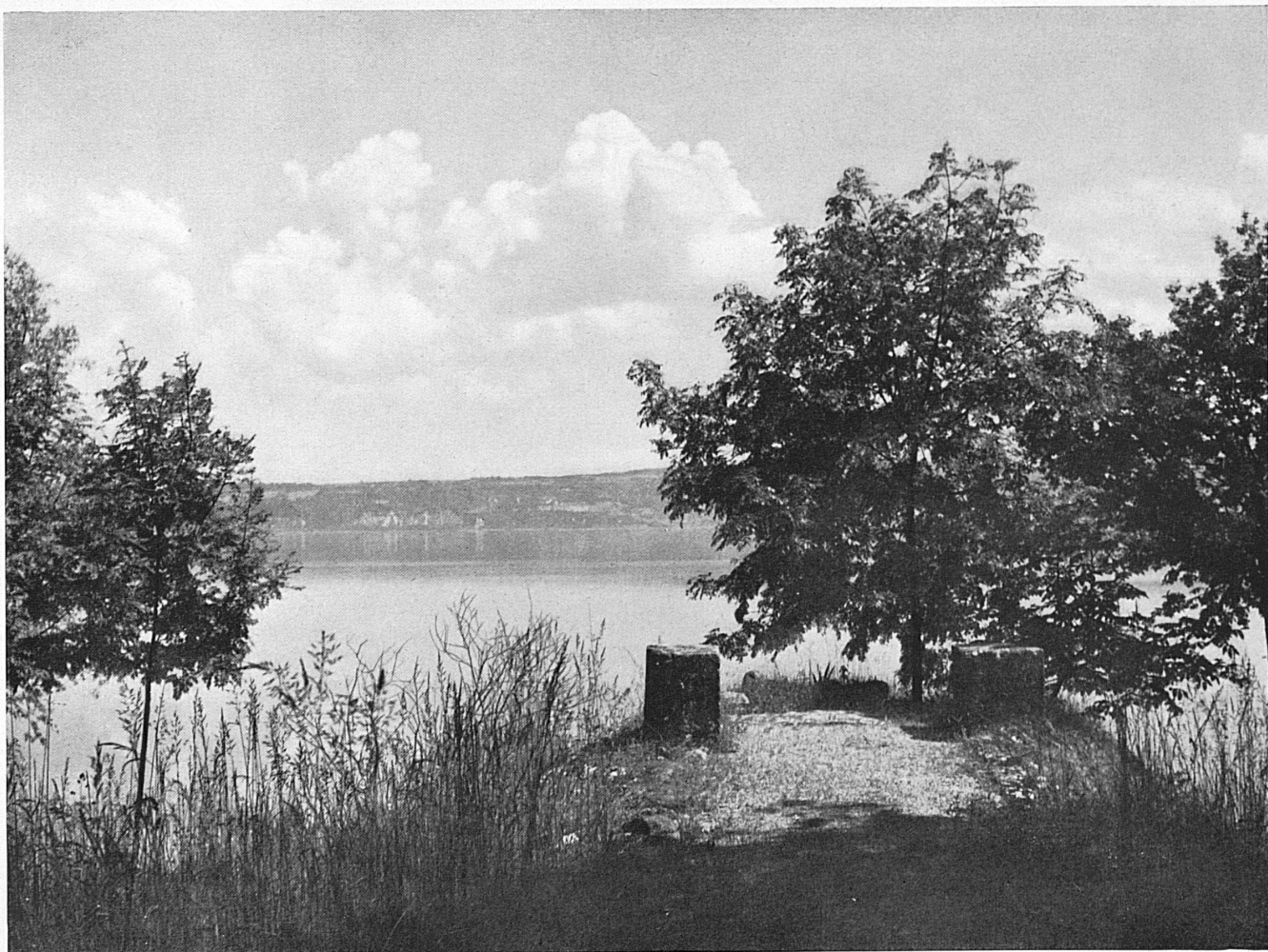
Au bord du lac de Neuchâtel près de Vaumarcus. Bei Vaumarcus am Neuenburgersee.*