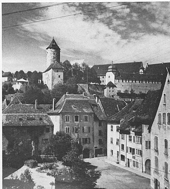
Links: Alter Turm in Delsberg.* Pruntrut.* Rechts: Môtiers, Val de Travers, Neuenburger Jura. Der Etang de Gruyère auf der weiten Hochebene des Berner Jura.*

A gauche: Vieille tour à Delémont. Porrentruy. A droite: Môtiers, dans le val de Travers, Jura neuchâtelois. L'Etang de Gruyère, sur le haut plateau des Franches-Montagnes, dans le Jura bernois.