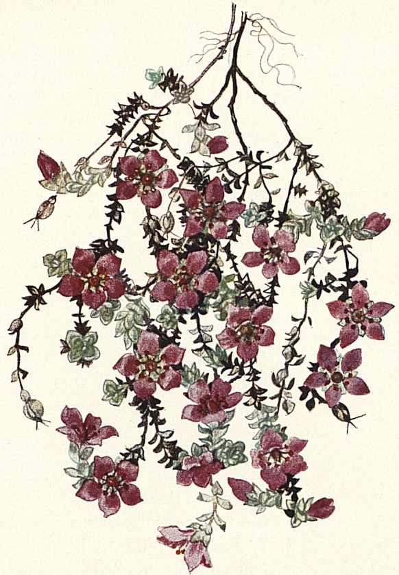
Schweizerischer Mannsschild Androsace Helvetica