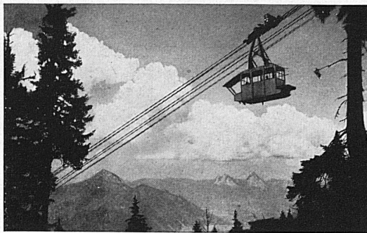
Luftseilbahn Beckenried - Klewenalp

Cette facilité n'est toutefois valable que pour les parcours dont la taxe de simple course (surtaxe pour trains directs non comprise) est d'au moins fr. 2.– pour la 3 me classe et fr. 2.80 pour la 2 me classe, ou si, lorsque le prix de la simple course est inférieur, le voyageur paie ce minimum.