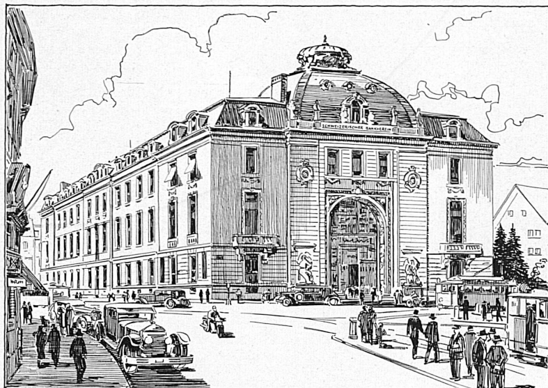
Bankgebäude in Zürich — Hôtel de la banque à Zurich