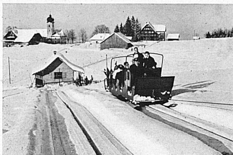
Schlittenseilbahn Heiligkreuz-First bei Hasle im Entlebuch