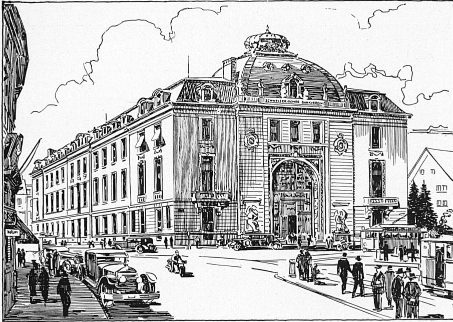
Bankgebäude in Zürich - Hôtel de la banque à Zurich