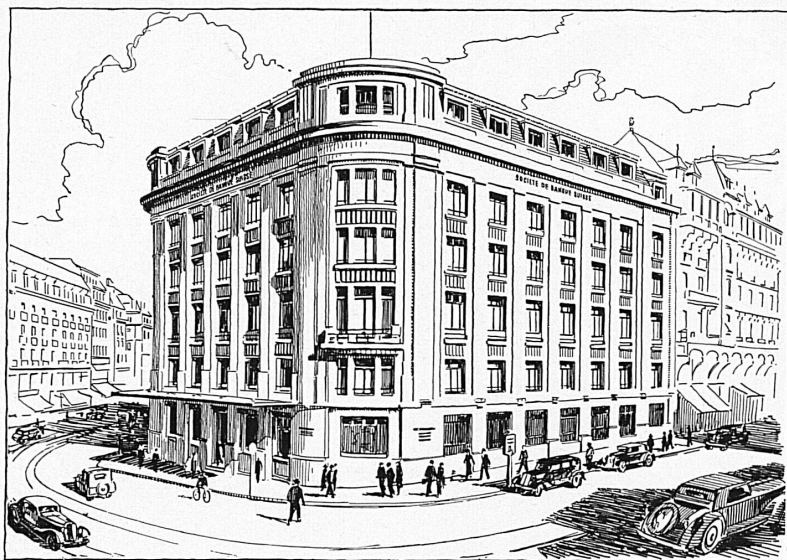
Hôtel de la banque à Genève — Bankgebäude in Genf