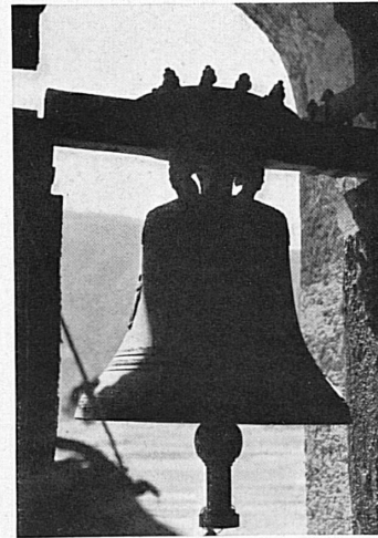
Gandria — Barke auf dem Lago Maggiore — Auf dem Campanile einer Kirche im Südteffin Gandria — Barque sur le lac Majeur — L'appel des cloches.