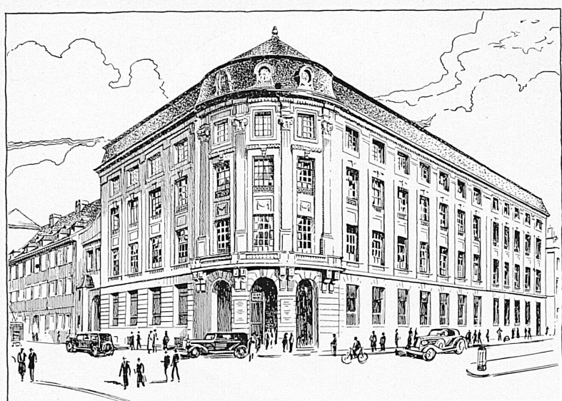
Bankgebäude in Basel — Hôtel de la banque à Bâle