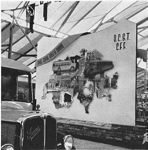
Oben links: Schweizer Bücher an der Wiener Herbstmesse vom 21. bis 28. September. Oben rechts: Die «heilende Schweiz» an der Leipziger Messe 31. August bis 4. September. Neben dem Titel: Der Schweizer Pavillon an der Internationalen Donaumesse in Bratislava 31. August bis 7. September. Mitte links: Zum erstmalig stellte die SZV auch an der Fiera Svizzera di Lugano, an der süd-schweizerischen Herbstmesse aus, und zwar unter dem Motto: «Gang, lueg d'Heimat a», «Va, ammira la tua patria». Mitte rechts: Die Karte der grossen Verkehrsmittel am Comptoir suisse. Unten: In Frankreich beteiligte sich die Schweiz an den grossen Messen in Marseille und Lyon vom 13. bis 28. September und vom 27. September bis 5. Oktober. Bild von der Schweizer Schau in Marseille.