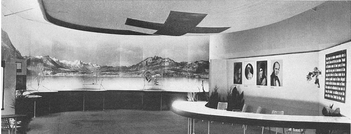
En haut à gauche: Le livre suisse à la Foire d'automne de Vienne (21-28 septembre 1941). En haut à droite: «La Suisse, terre de guérison» à la Foire de Leipzig (31 août-4 septembre 1941). A côté du titre: Le Pavillon suisse à la Foire internationale du Danube de Bratislava (31 août-7 septembre 1941). Au milieu à gauche: Pour la première fois l'OCST a figuré à la Fiera Svizzera di Lugano, notre Foire du Midi, en mettant en relief le mot d'ordre de l'année: Va, découvre ton pays - Va, ammira la tua patria! En bas: En France la Suisse a pris part aux deux grandes foires de Marseille (13-28 septembre) et de Lyon (27 septembre-5 octobre). Une vue du stand suisse de Marseille.