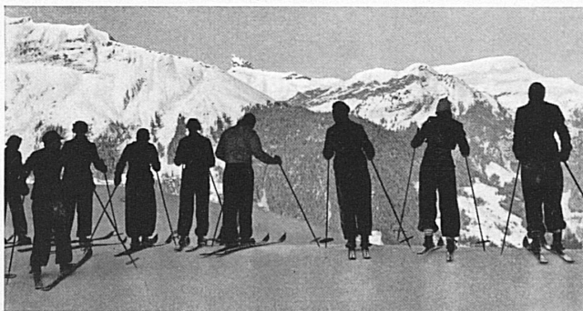
Skischule Wengen* A l'école suisse de ski de Wengen