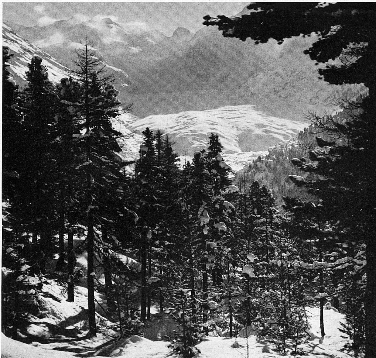
Im Skigebiet von Pontresina im Oberengadin. Blick auf den Morteratschgletscher und die Berninagruppe * Terrains de ski de Pontresina (Haute-Engadine): Vue sur le Glacier de Morteratsch et le massif de la Bernina.