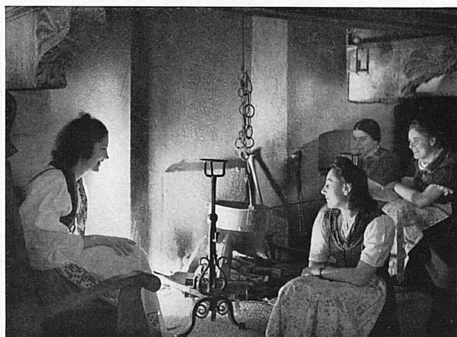
Kommt zur Fiera, kommt über den Gotthard und genießt im goldenen Herbst Tessiner Gastlichkeit und südlichen Charme! — Le Tessin vous souhaite la bienvenue.