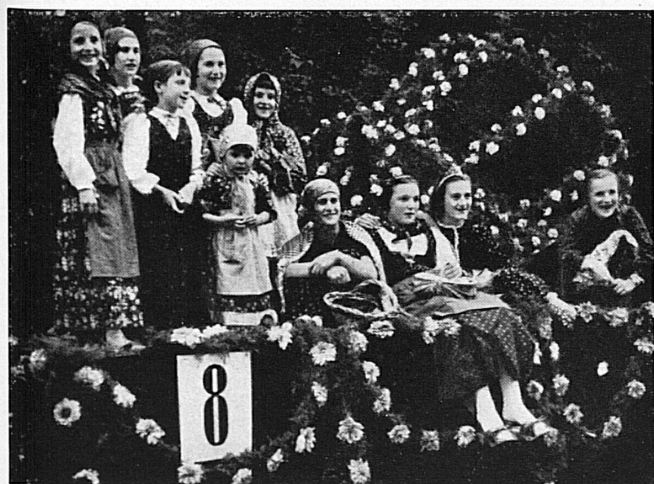
Der ganze, lebenslustige Tessin in einem Festzug, dem letztes Jahr 30 000 Zuschauer applaudierten. Bequeme Sitzplätze. Winzerfest am Sonntag, 4. Oktober. - Festspiel «Confederatio Helvetica» am 3., 10., 17., 18. Oktober. - «Große Revue» am 7., 8., 11. und 14. Oktober. — Le Tessin tout entier dans un cortège qui déborde de vie.

Visiter la Foire suisse de Lugano, c'est joindre l'utile à l'agréable - on y prendra contact avec de nouveaux producteurs et, plus que jamais, on appréciera les produits de nos confédérés tessinois.