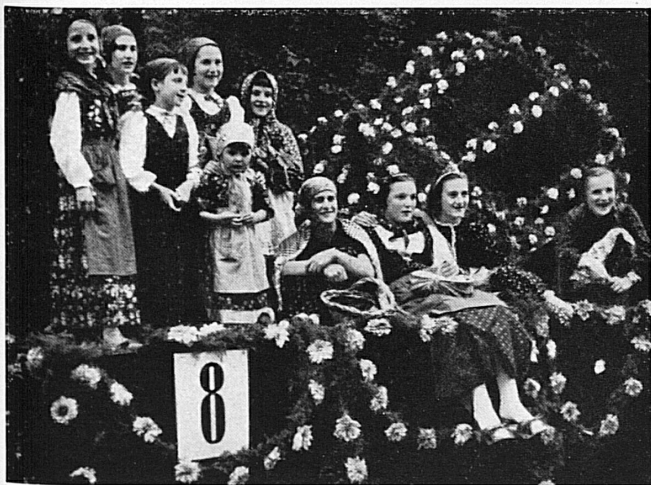
Der ganze, lebenslustige Tessin in einem Festzug, dem letztes Jahr 30 000 Zuschauer applaudierten. Bequeme Sitzplätze. Winzerfest am Sonntag, 4. Oktober. - Festspiel « Confederatio Helvetica » am 3., 10., 17., 18. Oktober. - « Große Revue » am 7., 8., 11. und 14. Oktober. — Le Tessin tout entier dans un cortège qui déborde de vie.

Visiter la Foire suisse de Lugano, c'est joindre l'utile à l'agréable - on y prendra contact avec de nouveaux producteurs et, plus que jamais, on appréciera les produits de nos confédérés tessinois.