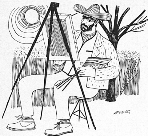
Zürich hat das Glück, die schönsten Werke aus der Reinhart-Sammlung noch bis Ende April in seinem Kunsthauus zu beherbergen