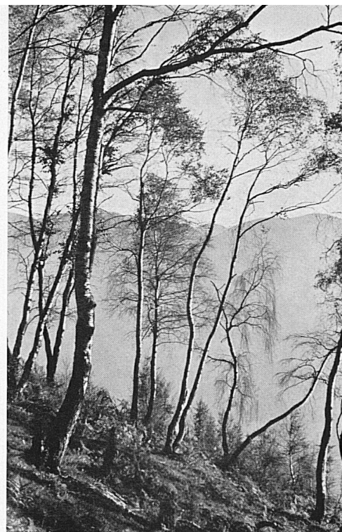
Auf dem Monte Brè bei Lugano im Winter*. An sonnigem Hang bei Locarno Le Monte Brè en hiver* Sur les collines ensoleillées de Locarno.