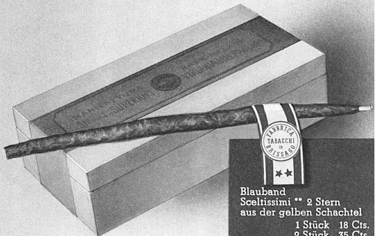
Blauband Sceltrissimi ** 2 Stern aus der gelben Schachtel 1 Stück 18 Cts. 2 Stück 35 Cts. 3 Stück 50 Cts.