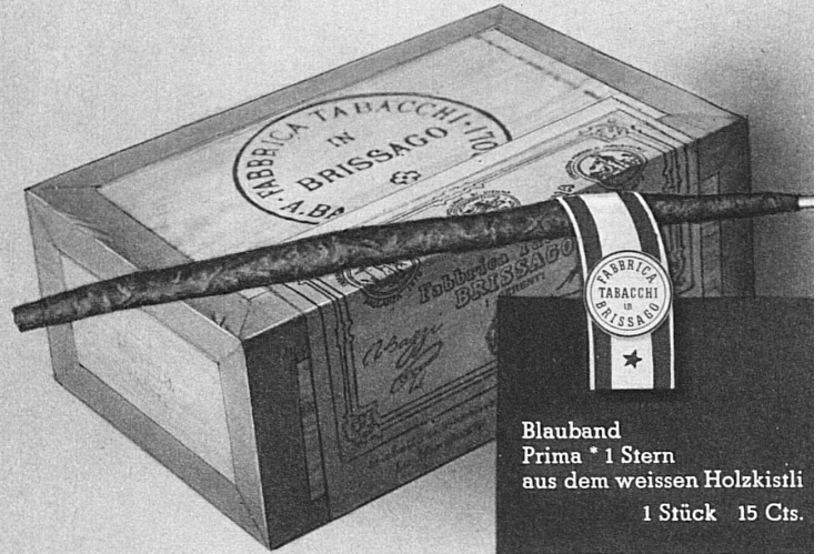
Blauband Prima * 1 Stern aus dem weissen Holzkistli 1 Stück 15 Cts.