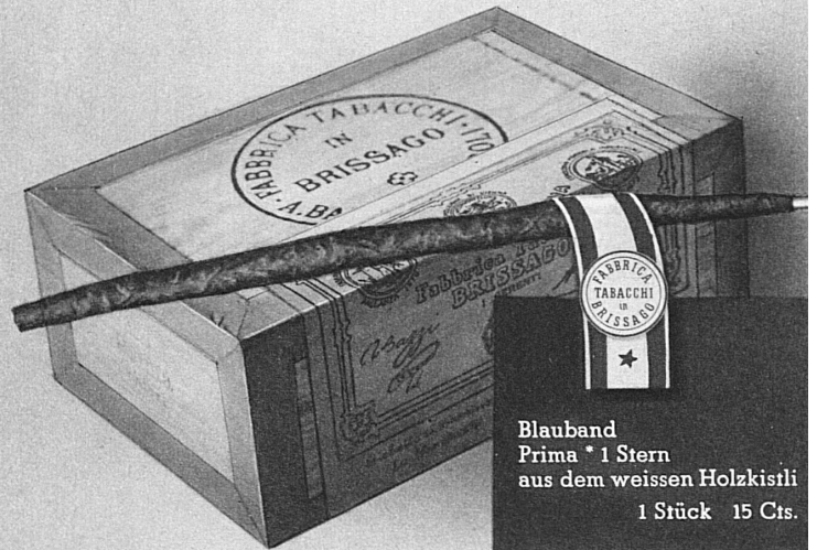
Blauband Prima * 1 Stern aus dem weissen Holzkisli 1 Stück 15 Cts.