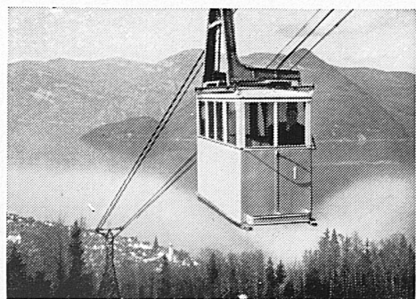
Mit der Luftseilbahn

Dr. ED. KLEINERT · ZÜRICH 8 Neumünsterallee 1 Telephon 2 08 81