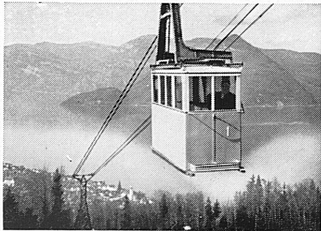
Mit der Luftseilbahn

Dr. ED. KLEINERT · ZÜRICH 8 Neumünsterallee 1 Telephon 2 08 81