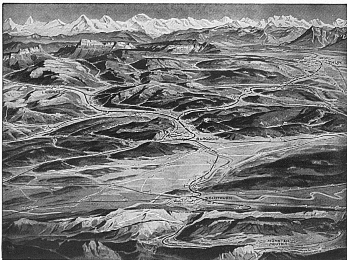
*) Blick von den Jurahöhen des Weissensteins nach Süden - Ausgangspunkte: Stationen Günsbrunnen und Oberdorf (Solothurn) - Autokurs Günsbrunnen-Weissenstein. Sonntagsbillette zu reduzierten Preisen

Jours d'ouverture: Jusqu'au 31 mai 1940: jeudi, samedi, dimanche Dès le 1 er juin 1940: tous les jours sauf lundi