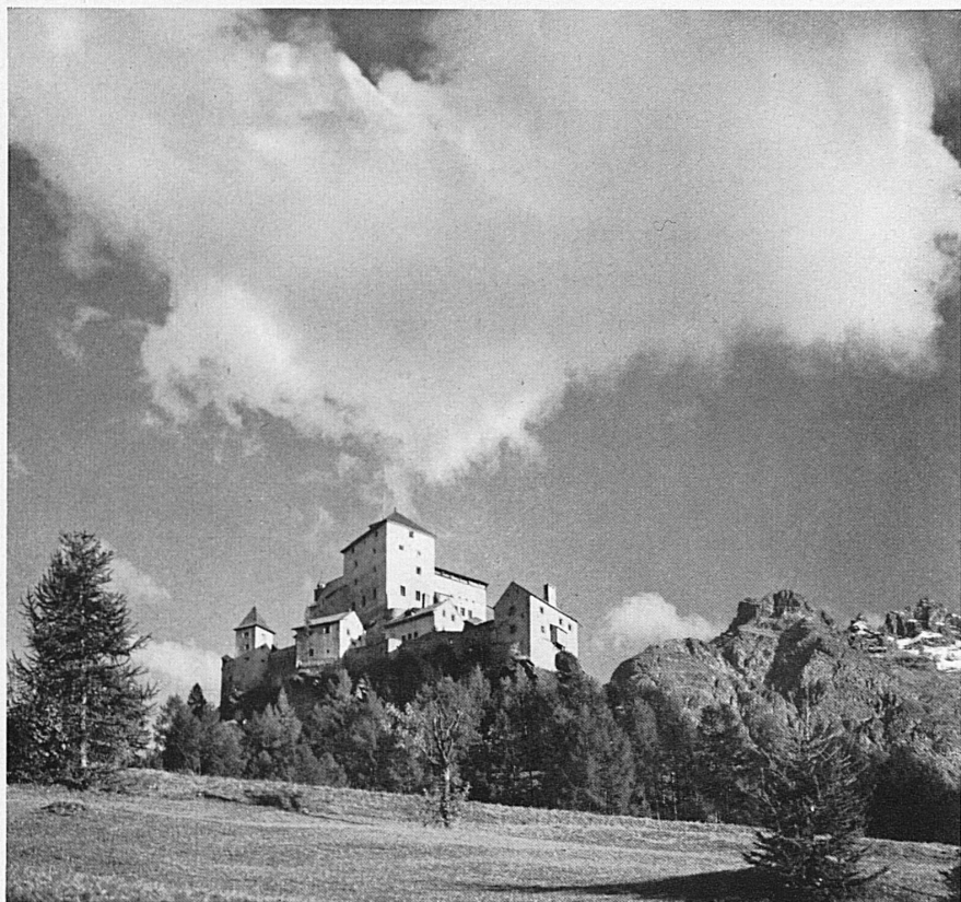
Le château de Tarasp au-dessus des Bains de Schuls-Tarasp-Vulpera Schloss Tarasp bei Bad Schuls-Tarasp-Vulpera