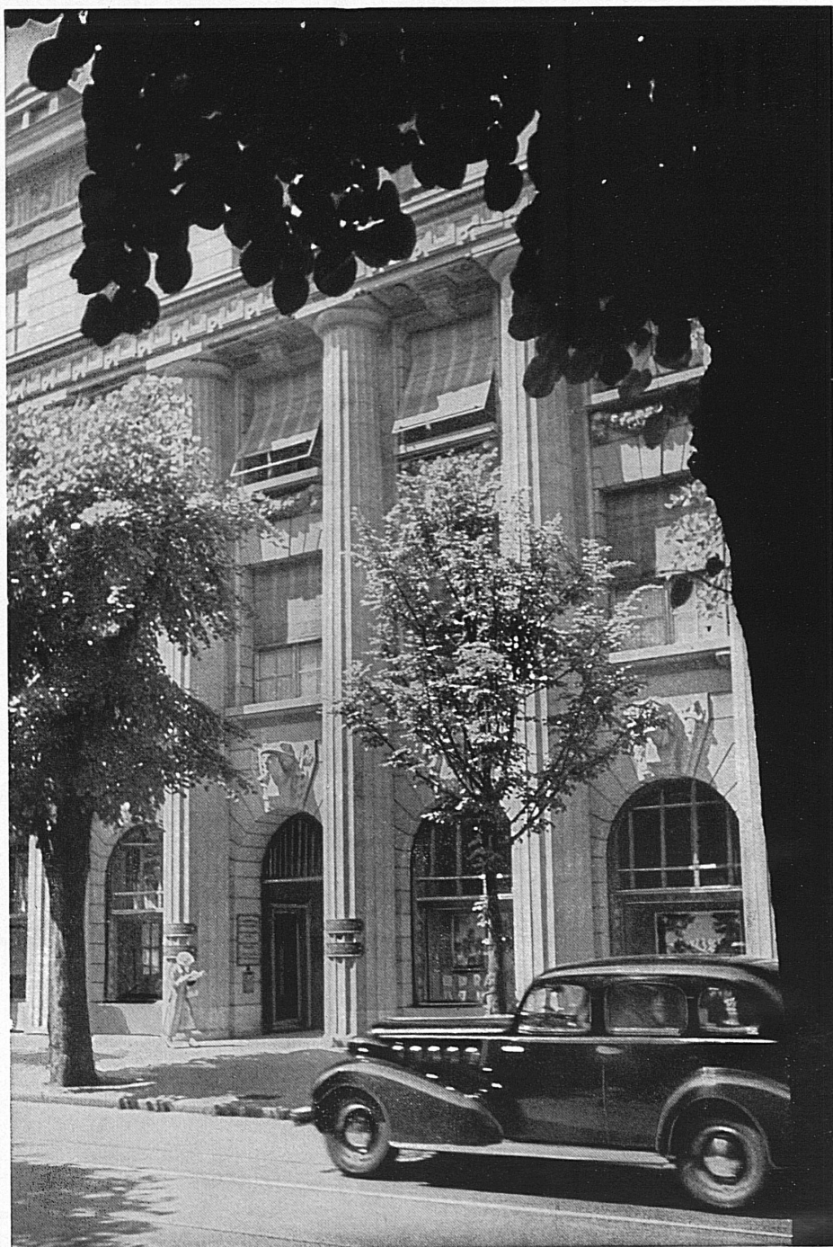
Eingang zum Bankgebäude in Zürich

Hoch überragte der touristische Fahnenmast mit seinen bunten Schildereien von Herbert Leupin die Abteilung der Schweizerischen Verkehrszentrale in der Halle III der Schweizer Mustermesse in Basel und bekundete den Durchhaltewillen des hart betroffenen schweizerischen Fremdenverkehrs. Möge im Laufe des Sommers auf manchem Schweizer Hotel in unsern Kurorten das weisse Kreuz im roten Feld fröhlich flattern, zum Zeichen, dass viele Tausende von Mitbürgern, die im Gastgewerbe tätig sind, dank der treuen Schweizer Kundschaft ihren Beruf auch heute ausüben können.