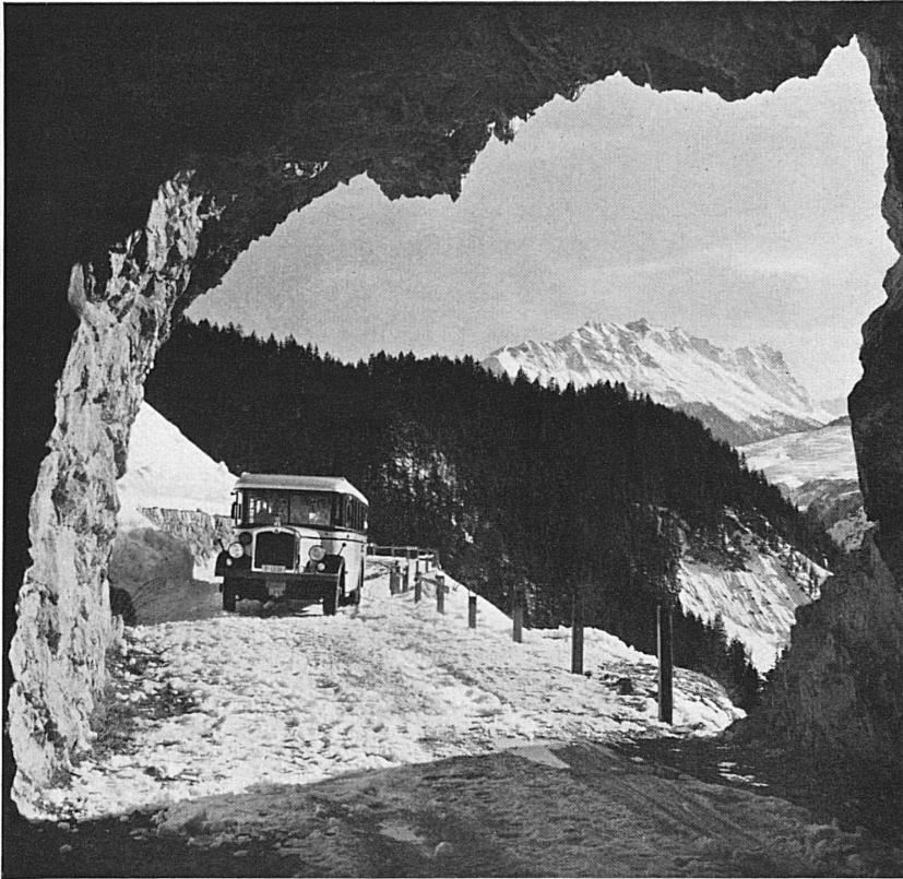
Zwischen Tiefencastel und Conters an der Julieroute. Blick gegen das Oberhalbstein

Entre Tiefencastel et Conters sur la route du Julier dans les Grisons. Vue sur l'Oberhalbstein