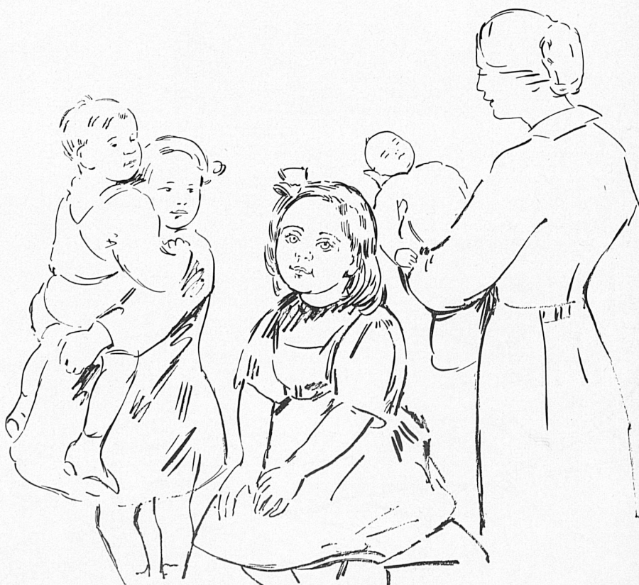
Zeichnungen, Dessins: Hanni Bay

Voici encore quelques chiffres éloquentes pour illustrer l'activité énorme déployée par l'Office central des œuvres sociales militaires et de ses succursales. Dans les huit premiers mois de l'année 1939, 5627 demandes de secours ont été enregistrées. Dans les six premières semaines après la mobilisation: 7314 demandes. Aujourd'hui, l'Office central verse par jour environ fr. 10,000.— de secours aux soldats et à leurs familles. En 1940, le Don national suisse et la Croix-Rouge organiseront de concert une collecte dans le peuple suisse, afin qu'ils puissent disposer des moyens financiers dont ils ont besoin pour accomplir leur tâche énorme. Par des versements grands et petits à cette collecte, chacun aura à cœur de contribuer à la grande œuvre en faveur des soldats et de leurs familles, pour qu'une fois de plus notre splendide devise nationale soit une magnifique réalité: Un pour tous, tous pour un!