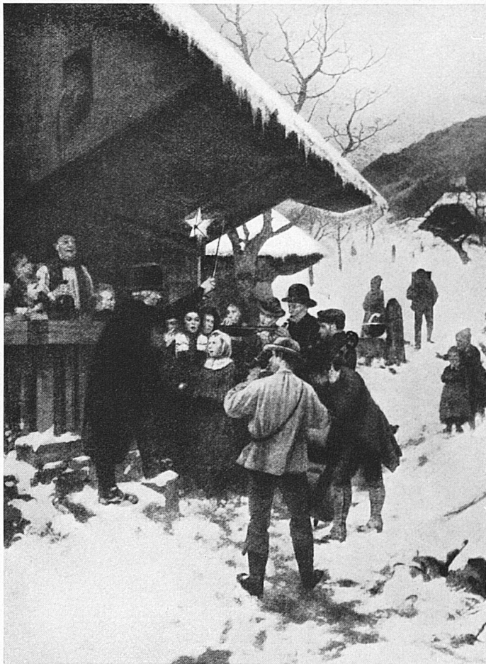
Weihnachtssingen im Kanton Luzern im 19. Jahrhundert, nach einem Gemälde von Hans Bachmann Les chanteurs de Noël dans le canton de Lucerne, d'après un tableau de Hans Bachmann

Jusque vers la fin du XIX me siècle, adultes et enfants se rassemblaient devant les fermes pour y chanter les hymnes de Noël, et attendre l'étréne que le paysan réservait à ces musiciens, généralement accompagnés d'un violon et d'une clarinette. La même coutume existait dans les Franches-Montagnes, aux Breuleux en particulier. Dans certaines régions, aux Grisons et en Argovie entre autres, elle s'est maintenue jusqu'à nos jours.