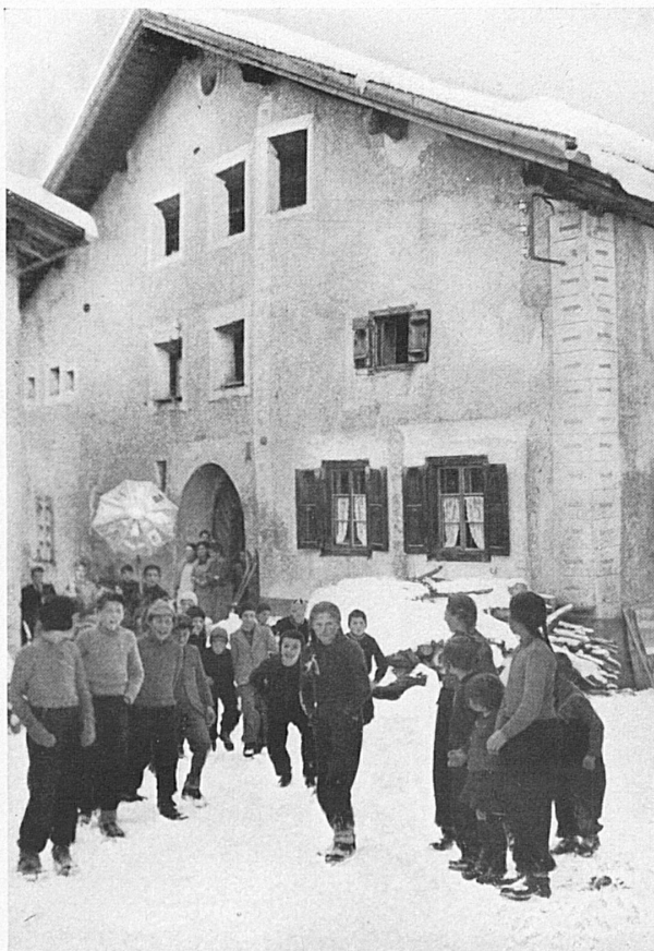
Sternensingen in Bergün am Silvester-Abend. Pour fêter la St-Sylvestre, la jeunesse de Bergün se réunit, et, fidèle à la vieille coutume se met à «chanter l'étoile»