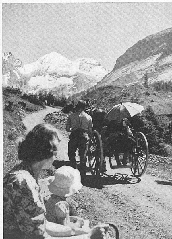
Entre ciel et terre au-dessus d'Engelberg — Zwischen Himmel und Erde, hoch über dem Tal von Engelberg *