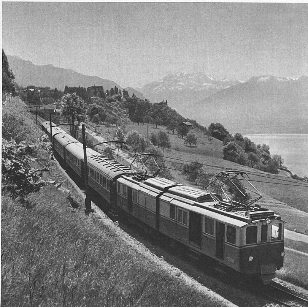
Aus dem Alpenland geht es hinunter an die Gestade des Genfersees — Le MOB forme le trait-d'union entre les Alpes et le Léman

blauweissen Wagen der MOB emporsteigen und auf dem Höhenweg nochmals das Bild dieses schönen Ferienreichs in sich aufnehmen, bevor ihn die Fahrt zwischen Alpengrün und Schnee durch Wälder und Weiden an rauschendem Bergwasser entlang ins Herz des Berner Oberlandes, in den Spiezer Frühling bringt. Wer aber umgekehrt die Montreux-Oberland-Linie für den Hinweg wählt, dem wird die Reise zum Erlebnis einer immerwährend erfüllten und durch die Teilerfüllungen alle bis zum grossen Schluss, der Talfahrt an den See, gesteigerten Erwartung.