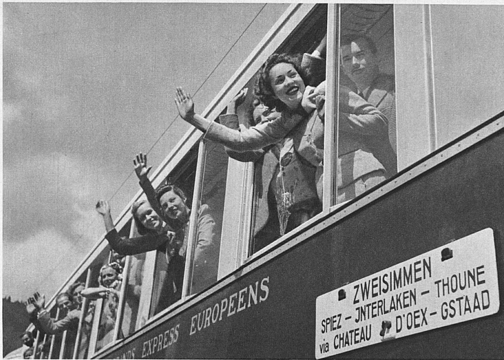
Glückliche Jugend der Pensionate und Schulen am Genfersee auf einem Ausflug mit der MOB ins Berner Oberland — De joyeuses écoles de la Suisse romande en route par le MOB pour l'Oberland bernois

Thunersees zu den schneereichen Höhen der Lenk, von Zweisimmen über die Saanenmöser nach Gstaad, Saanen und Château-d'Oex, vom Pays-d'Enhaut hinüber zu den Waadtländer Höhenstationen und bis hinunter nach Montreux. Gerade darum aber, weil sie an Tal- und Höhenfahrten, an wechselnden Ausblicken, an freundlich behäbigen Wegstationen so reich ist, gehört die Montreux-Oberland-Bahn zu den schönsten, lohnendsten Strecken der Schweiz. Wer über Freiburg ins Welschland gefahren und hier seine Frühlingsferientage genossen hat, mag mit doppelter Empfänglichkeit mit den