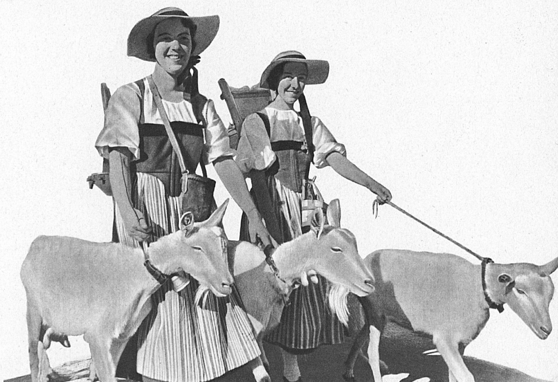
Junge Saanerinnen mit Saanen- geissen — Jeunes Bernoises gardeuses de chèvres à Gessenay

Der andere Weg ist weniger kurz, weniger zielsicher vielleicht; denn zahlreich sind zur Rechten und zur Linken seiner phantasievollen Bahn die Orte, die zum Verweilen einladen: von den Frühlingsufern des