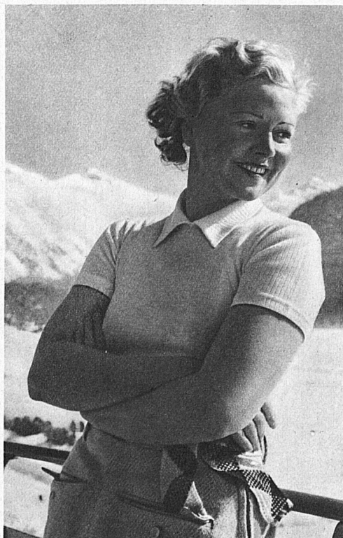
Liane Haid, German film star, at St. Moritz — Liane Haid à Saint-Moritz — Liane Haid in St. Moritz

Wer die Fremdenliste eines grossen Schweizer Wintersportplatzes durchsieht, wird staunen über die Vielzahl der Herkunftsländer, über die unübersehbare gesellschaftliche Buntheit des Publikums. Es hat seinen ganz besondern Reiz, in diese Menschheit im kleinen einzutauchen, die ein Hotel während der Saison beherbergt. Wunderbar aber ist es, zu erleben, wie alle, von der königlichen Hoheit bis zum einfachen Bürger, vom Minister und berühmten Filmstar bis zum Kinde, völlig unter dem beglückenden Zauber des Schnees und des Sportes stehen.