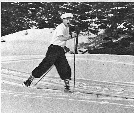
H. M. King Leopold III of the Belgians at Montana-Yermala — S. M. Léopold III, roi des Belges, à Montana-Yermala — S. M. Leopold III. König der Belgier, in Montana-Yermala