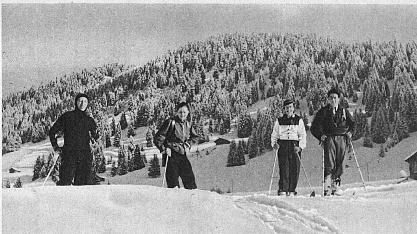
The well-known French tennis player René Lacoste (left) with his family at Villars-Chesières — René Lacoste, le célèbre champion français de tennis (à gauche) avec sa famille, à Villars-Chesières — Der grosse französische Tennisspieler René Lacoste (links) mit seiner Familie in Villars-Chesières