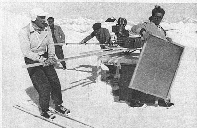
Right: Luis Trenker filming on the Parsenn near Davos — A droite: Luis Trenker prend un film à Parsenn près de Davos — Rechts: Luis Trenker filmt auf Parsenn bei Davos