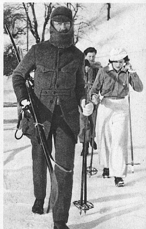
Prof. Piccard, the stratosphere explorer, at Grindelwald — Le professeur Piccard, vainqueur de la stratosphère, à Grindelwald — Prof. Piccard, der Stratosphärenflieger, in Grindelwald