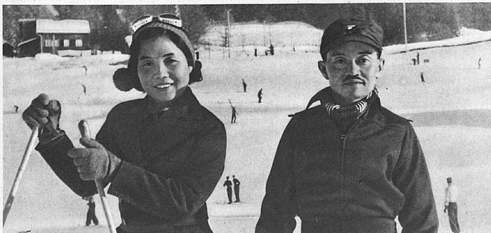
The ex-King and ex-Queen of Siam on a Winter sports holiday at Wengen — L'ex-roi et l'ex-reine de Siam s'adonnant aux sports d'hiver, à Wengen — Der Exkönig und die Exkönigin von Siam beim Wintersport in Wengen

A glance through the Visitors' List in a large Swiss winter sports resort reveals a surprisingly large number of nationalities and an almost unlimited diversity of social ranks. It is quite fascinating to make one's observations in this connection, for a large hotel during the winter season forms a little world of its own. But one thing is significant — all these people, whether royalty or ordinary mortals, whether statesmen or film stars or children, are there to enjoy themselves, and in the same manner. One and all, they are under the irresistible spell of snow and winter sports.