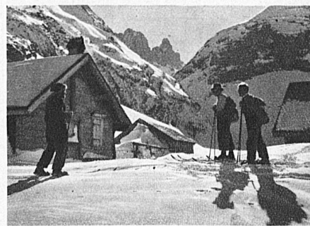
Skifahrer auf der Furgglenalp, im Gebiet der Säntisbahn (Appenzell—Wasserauen). Im Hintergrund die Kreuzberge.

Für jede weitere Auskunft bezüglich weiterer Fahrpreise, Unterkunft, Verpflegung usw. wende man sich an die Reise-Organisationsstellen in den grösseren S B B-Bahnhöfen.