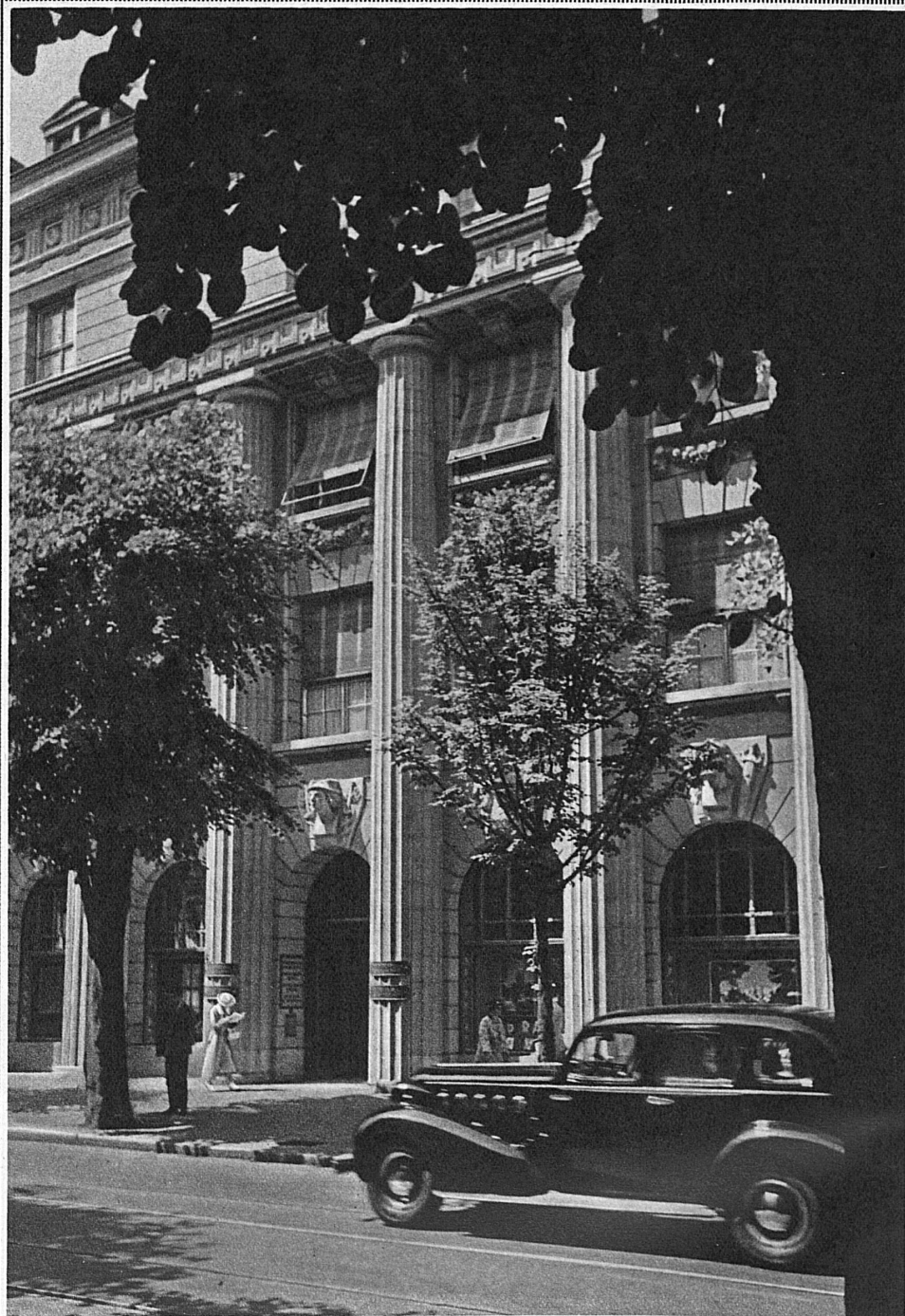
Eingang zum Bankgebäude in Zürich

Wir haben immer Verwendung für gute Aufnahmen von Schweizer Landschaften, Architektur, Volksleben, Sport, Reiseverkehr, Autotourismus usw. Vor allem kommt es auf die Lebendigkeit und Originalität, auf die erstklassige technische Qualität der Photographien an. Es kommen nur Schweizer Sujets in Frage. Wir bitten um Auswahlendungen an «Photodienst der Schweiz. Verkehrszentrale», Zürich, Bahnpostfach.