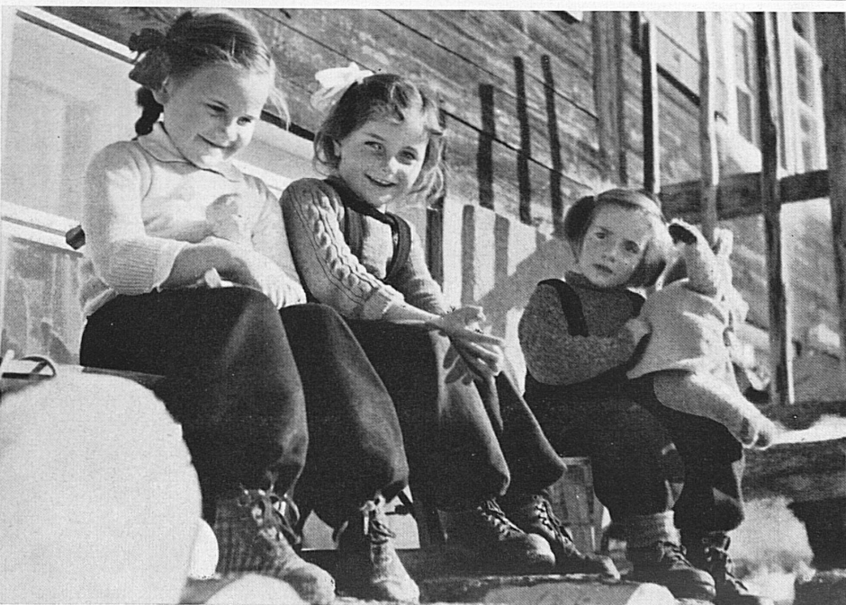
Links Mitte: Auf der sonnenwarmen Spaltenbeige ruhen sich die kleinen Berner Oberländerli von ihren Taten aus