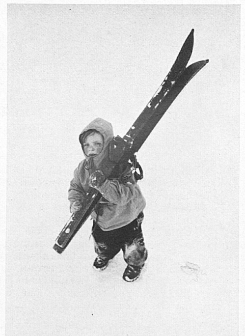
Sonniges Braunwald · Braunwald au soleil!