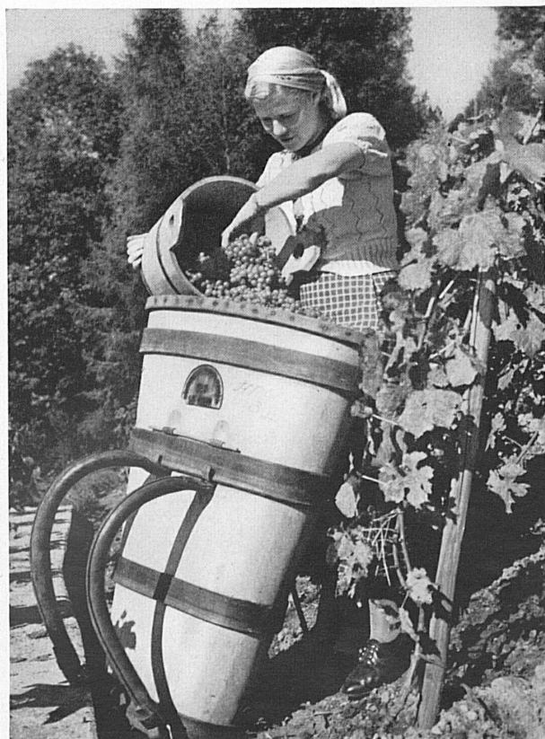
Winzerzeit bei Oberhofen — Vendanges à Oberhofen