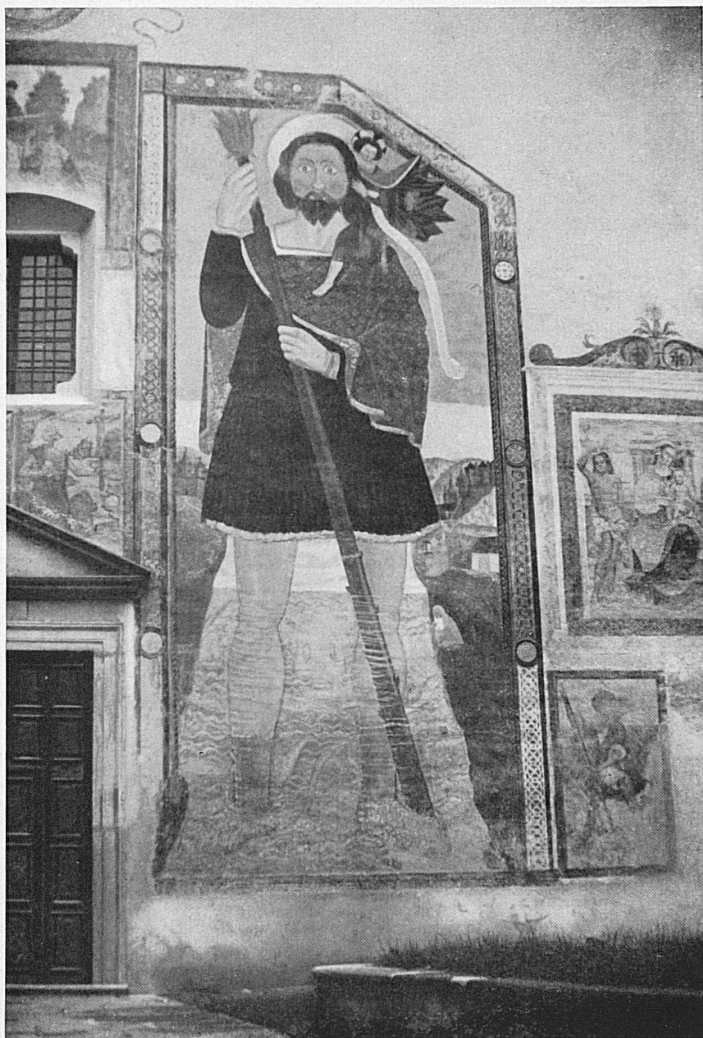
Le Saint Christophe de Malvaglia St. Christoph von Malvaglia St. Christopher at Malvaglia