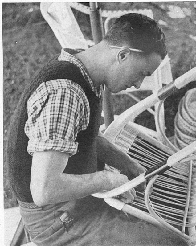
Travaux et fêtes du peuple tessinois