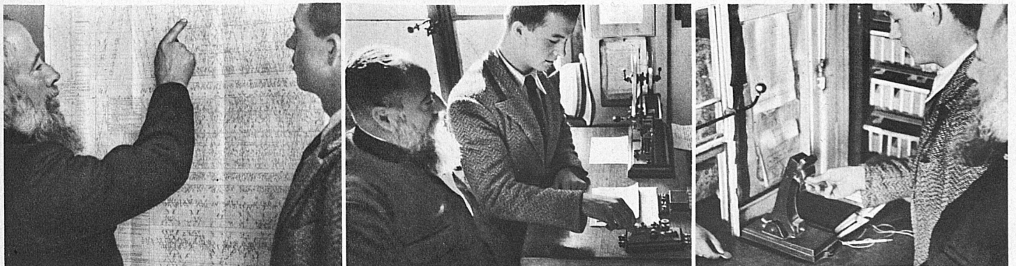
Links: Der graphische Fahrplan, nach dem der Zugabfertigungsbeamte seine Dispositionen trifft. Mitte: Nach einer Vorschulung am Übungstaster, darf der Lehrling bald unter Aufsicht Telegramme abschicken und abnehmen. Rechts: Am Billettschalter kommt der Lehrling in Berührung mit dem Publikum. Die Kasse muss nach Tagesabschluss stimmen — A gauche: Le plan graphique, d'après lequel le fonctionnaire chargé de l'expédition des trains prend ses dispositions. Au milieu: Après une brève période de préparation au manipulateur d'exercice, l'apprenti peut, sous surveillance, expédier et recevoir lui-même des télégrammes. A droite: Au guichet des billets, l'apprenti a l'occasion d'entrer en contact avec le public. Chaque soir la caisse doit jouer.

geschichte und Schweizer Staatskunde wird zunächst die Schulbildung festgestellt; es folgt dann eine psychotechnische Eignungsprüfung, und endlich, wenn auch die Erkundigungen über den Charakter günstig lauten, eine eingehende ärztliche Untersuchung. Der aufgenommene Lehrling wird nun für eine zweijährige Lehrzeit einer geeigneten Lehrstation zugewiesen. Die ersten drei Monate gelten als Probezeit. Der Vorstand übernimmt für die zweckmässige und gründliche Ausbildung die persönliche Verantwortung. Über den behandel-