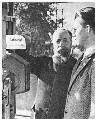
Unterricht über das Ein- und Ausschalten der Fahrleitung — Démonstration du système d'enclenchement et de déclenchement du courant de la traction

volle Tage und wird vom Oberbeamten abgenommen. Ist sie bestanden, so wird der Lehrling zum « Aspiranten » ernannt. Er verbleibt in dieser Stellung 20 Monate und verbringt diese Zeit zum Teil in fremdsprachigem Gebiet. Nun erst tritt der Aspirant, wenn seine Leistungen befriedigend sind, in die Laufbahn des Betriebsbeamten ein, die dem berufsbegabten, dienstfreudigen und charakterfesten Mann schöne Aufstiegsmöglichkeiten in allen Dienstzweigen eröffnet. -ck.