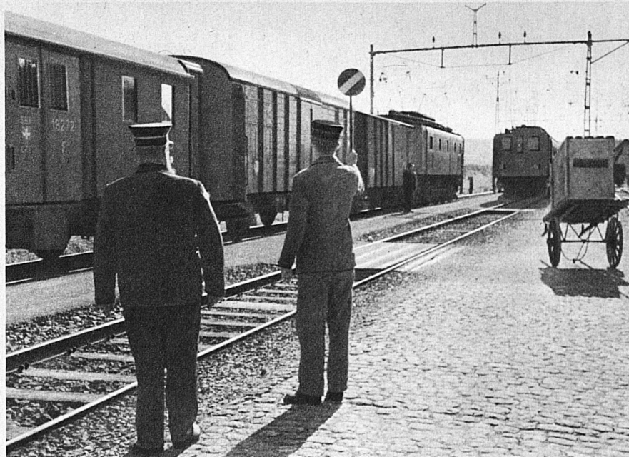
Der langersehnte Moment: die erste Zugsabfertigung — L'instant ardemment désiré: l'expédition du premier train

Den Abschluss der Lehrzeit bildet eine Fachprüfung, die sog. Wahlfähigkeitsprüfung. Sie dauert zwei