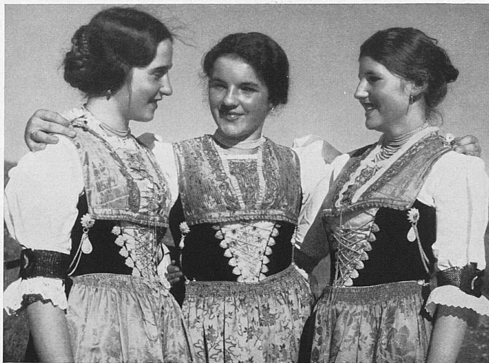
Appenzeller Trachten — Appenzelloises en costume