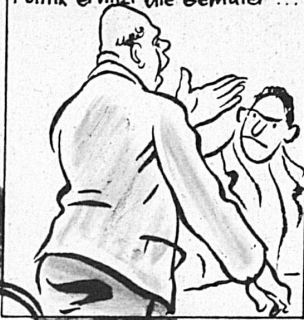
Politik erhitzt die Gemüter ...