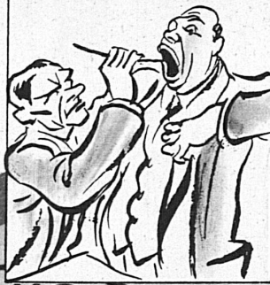
und die Blauband, besänftigt sie