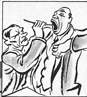
und die Blauband, besänftigt sie