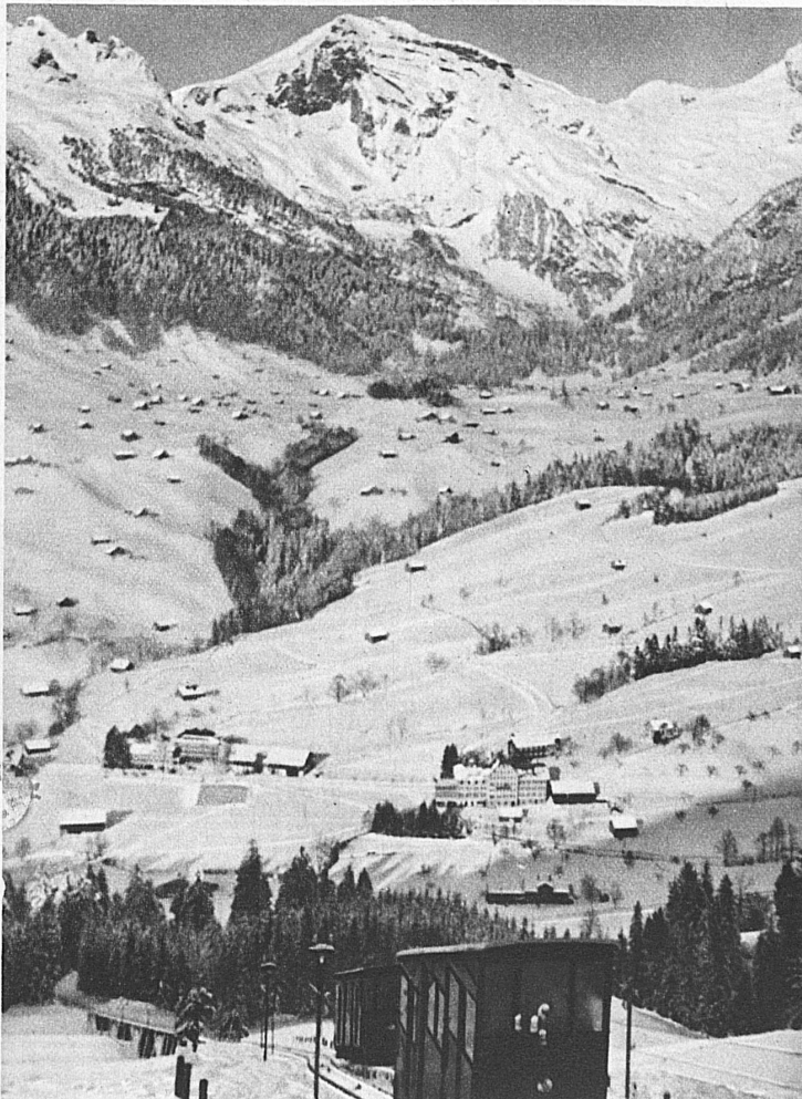
The Unterwasser-Ilstos Cable Railway (East Switzerland) — Le funiculaire Unterwasser-Ilstos (Suisse orientale) — Die Drahtseilbahn Unterwasser-Ilstos (Ostschweiz)