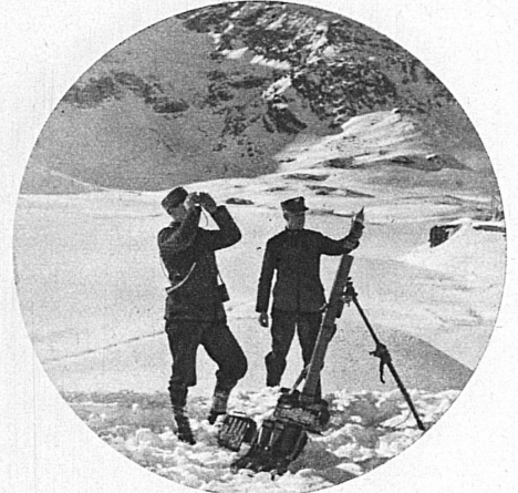
Threatening avalanches are artificially brought down on the Bernina Railway route — Détachement d'une avalanche artificiellement provoquée sur la voie du chemin de fer de la Bernina — Auf der Berninabahnstrecke werden Lawinen künstlich zur Loslösung gebracht

Sie fahren in die Schweizer Winterferien, um sich zu erholen. Auch der Sport soll diesem Zwecke dienen. Sie werden darum Ihre Kräfte schonen. Ausserdem ist Ihre Zeit sehr kostbar. Wie rasch pflegt sie nicht gerade während der Ferien vorüberzuffliegen! Und ein Wintertag ist nicht so lang wie ein Hochsommertag! Darum raten wir Ihnen an: Benützen Sie soviel als möglich für den Aufstieg die Bergbahn, die Schwebebahn, die Schlittenseilbahn, das Postauto, den Skilift. All diese angenehmen Beförderungsmittel zum Start der schönen Schweizer Abfahrten sind die besten Zeit- und Mühesparer, die man sich denken kann. Sie sind nicht nur in einigen wenigen, sondern in der Mehrzahl der schweizerischen Wintersportgebiete zu finden und sind mit ihren Zwischenhalten und mit den schweren und