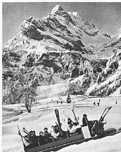
The ski-ers' sledge-hoist at Braunwald (East Switzerland). In the background, the Ortstock — La «skiluge» de Braunwald (Suisse orientale) A l'arrière-plan: l'Ortstock — Der Skischlitten von Braunwald (Ostschweiz). Im Hintergrund der Ortstock

A ceux qui acceptent un conseil, nous dirons: Utilisez autant que vous le pourrez les chemins de fer de montagne, les téléphériques, les ski-lifts, les ski-luges et les voitures postales. Tous ces agréables moyens de transport au départ des belles randonnées alpestres sont en vérité des