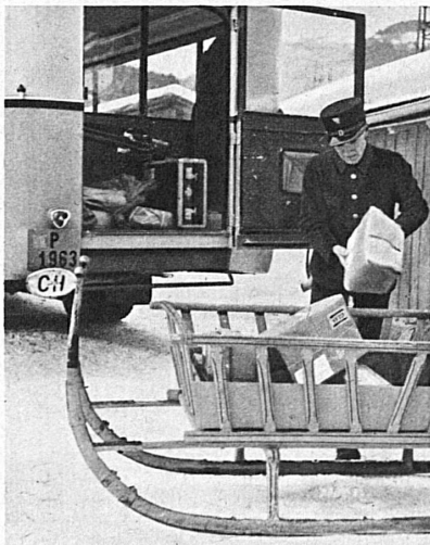
The Julier postal motor-coach — Poste du Julier — Die Julierpost

Right: Arrival of ski-ers by motor-coach at «Vue des Alpes» (Jura) — A droite: Arrivée des skieurs en autocar à la «Vue des Alpes» (Jura) — Rechts: Ankunft der Skifahrer im Autocar auf der «Vue des Alpes» (Jura)