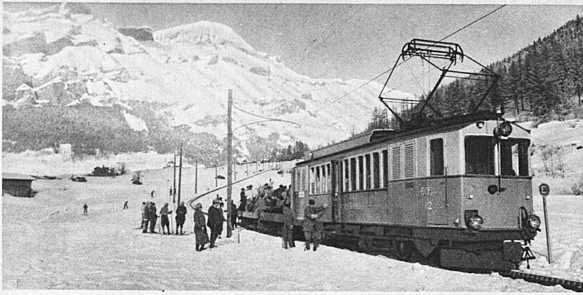
Left: Rack-and-pinion railway Leuk-Leukerbad (Valais) — A gauche: Le chemin de fer à crémaillère de Loèche à Loèche-les-Bains (Valais) — Die Zahnradbahn Leuk-Leukerbad (Wallis)

moyens admirables pour épargner son temps et ses forces. On les trouve à disposition non seulement dans quelques stations d'hiver de la Suisse, mais dans le plus grand nombre d'entre elles. Grâce à leurs haltes intermédiaires, aux grands et aux petits départs qu'elles rendent possibles, elles répondent aux capacités sportives les plus variées. Elles permettent même au simple touriste, épris d'air pur, de soleil montagnard, de détente et de doux far-niente, d'atteindre sans effort les plus beaux points de vue des Alpes et les hauts plateaux ensoleillés.