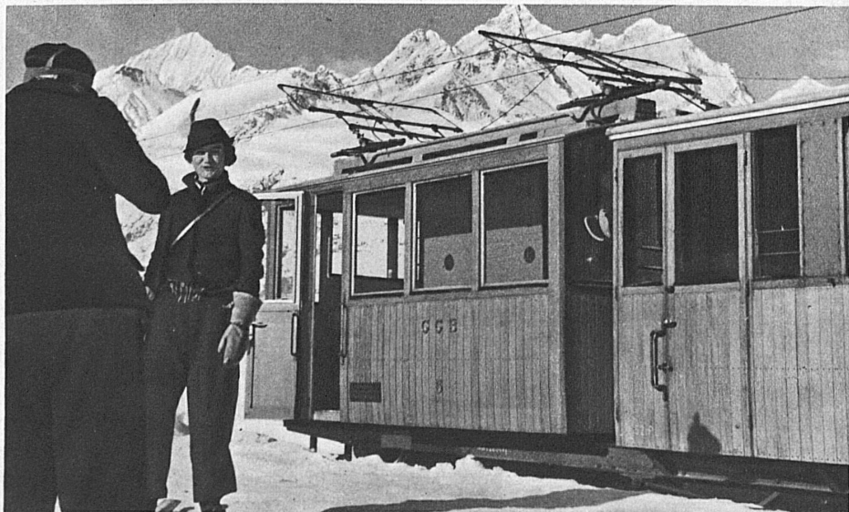
The Gornergrat Railway (Valais) — Le chemin de fer du Gornergrat (Valais) — Die Gornergratbahn (Wallis)