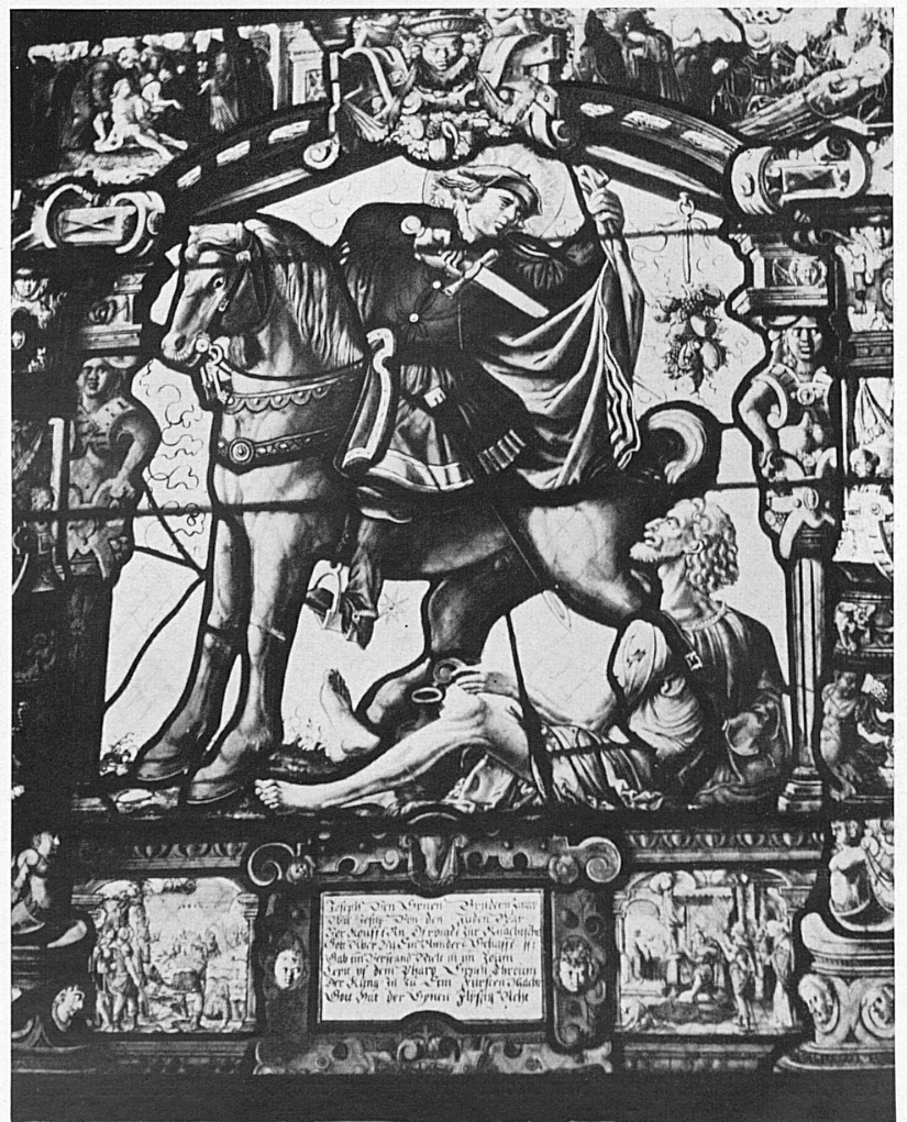
En haut: Le château de Wildegg, propriété de la Confédération, restauré et conservé par le Musée national suisse A gauche: Escalier à Wildegg En bas: Un des célèbres vitraux de l'ancienne abbaye de Wettingen près de Baden, représentant St. Martin

Es werden nun von Kunsthistorikern geführte Touren organisiert, auf denen das gezeigt wird, was vor allem sehenswert ist. Diesen Sommer werden von der Schweizerischen Verkehrszentrale, dem Fremdenverkehrsverband und der Postverwaltung zunächst von der Landesausstellungsstadt Zürich aus Kunst- und Burgenfahrten veranstaltet, jeden Dienstag zu den Burgen, Schlössern und Klöstern am Rhein, jeden Mittwoch zu den kunstgeschichtlichen Denkmälern der Innerschweiz, jeden Donnerstag zu den Burgen des Zürcherlandes und den Kunststätten des Weinlandes und jeden Freitag in den Aargau. Die Bilder, die wir auf diesen beiden Seiten zusammengestellt haben, stammen alle von dieser letztern Fahrt. Weit über diesen Umkreis hinaus zielen die Wochenend-Kunstreisen und Burgenfahrten, die in den Kanton Solothurn, ins Baselland und in die Ostschweiz führen. Die Reisebureaux vermitteln die Fahrten zu vorteilhaften Pauschalpreisen, in denen Reise, Verpflegung und Führung inbegriffen sind. b.