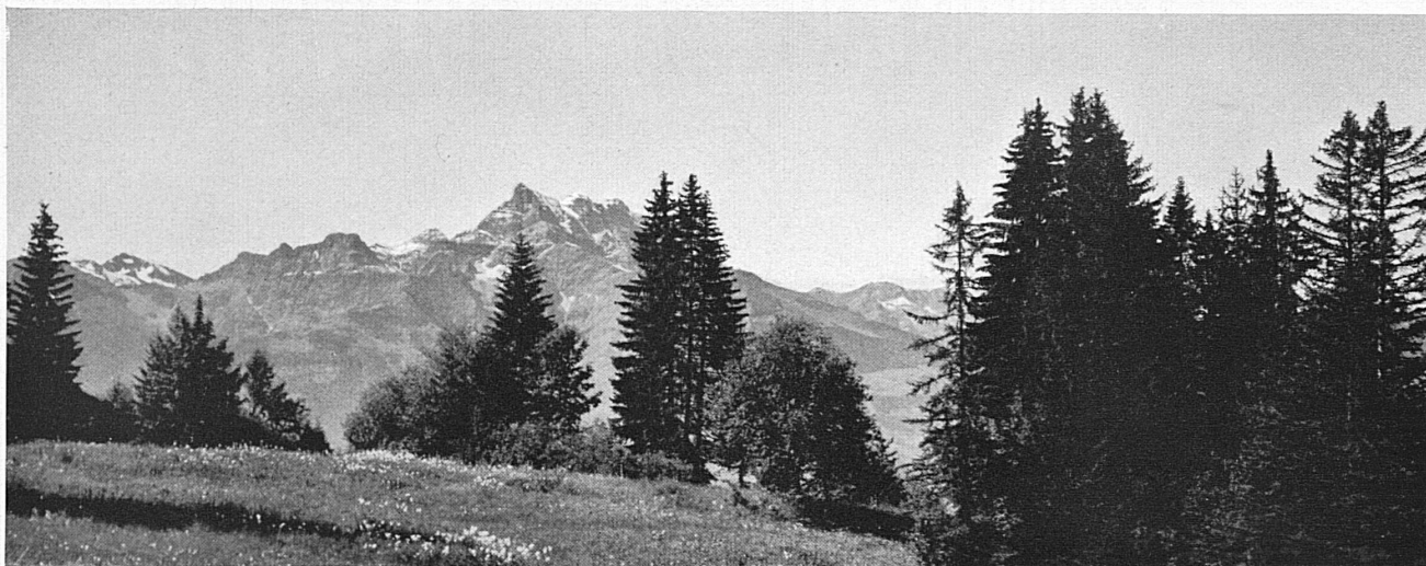
Die Dents du Midi von Villars aus gesehen — Les Dents du Midi vues de Villars