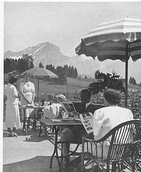
Ruhe und Erholung, Sport und Geselligkeit bietet der Schweizer Höhenkurort seinen Gästen Les stations suisses d'altitude vous offrent le repos, le sport et les agréments de la vie mondaine