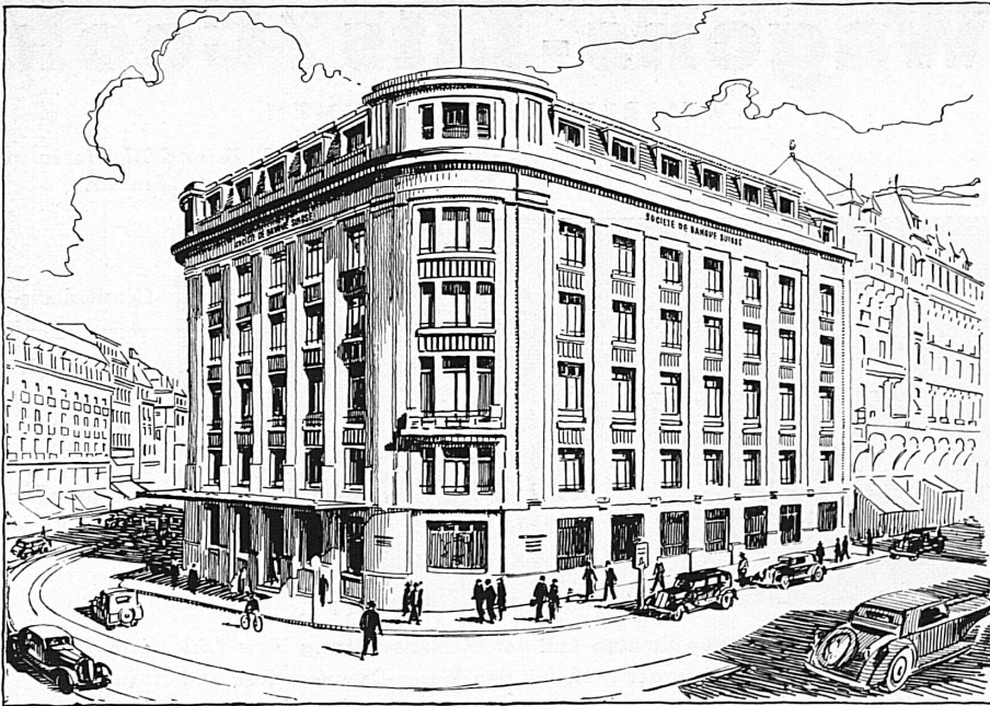
Bankgebäude in Genf · Hôtel de la banque à Genève