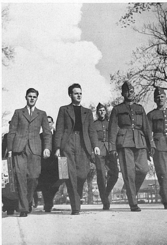
Junge Bürger rücken zur Rekrutenschule ein — Ein Mann vom Landsturm

Aus der Erklärung des Bundesrates in der Bundesversammlung, 21. März 1938.