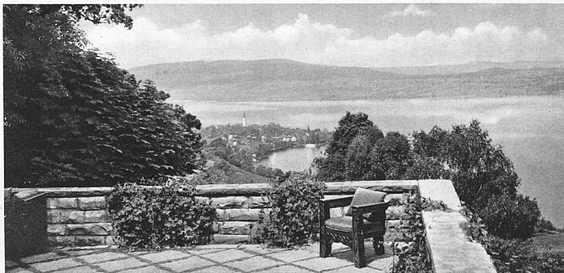
En haut: Vue de la terrasse sur le lac — Oben: Blick von der Terrasse auf den Untersee