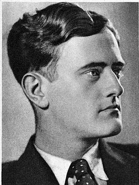
Der junge Berner Komponist Heinrich Sutermeister — Le jeune compositeur bernois Heinrich Sutermeister

Der Häusermannsche Privatchor erliess 1937 ein internationales Preisausschreiben für Chorwerke. Den ersten Preis erhielt der 1910 geborene Berner Komponist Heinrich Sutermeister für seine «Andreas Gryphius-Kantate» für gemischten Chor a cappella. Dieses Werk wird unter Leitung von Hermann Dubs durch den Häusermannschen Privatchor Sonntag, den 20. März, abends 8 Uhr, in Zürich im grossen Tonhallsaal uraufgeführt und am 27. März im Basler Stadttheater wiederholt. Das Programm umfasst ausserdem ein Divertimento für Streichorchester von Heinrich Sutermeister, ein Konzert für Streichorchester von Willi Burkhard und Burkhard's 93. Psalm für einstimmigen gemischten Chor und Orgel. Es wirkt mit das Basler Kammerorchester unter Leitung von Paul Sacher.