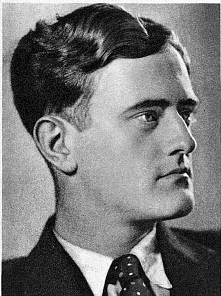
Der junge Berner Komponist Heinrich Sutermeister — Le jeune compositeur bernois Heinrich Sutermeister