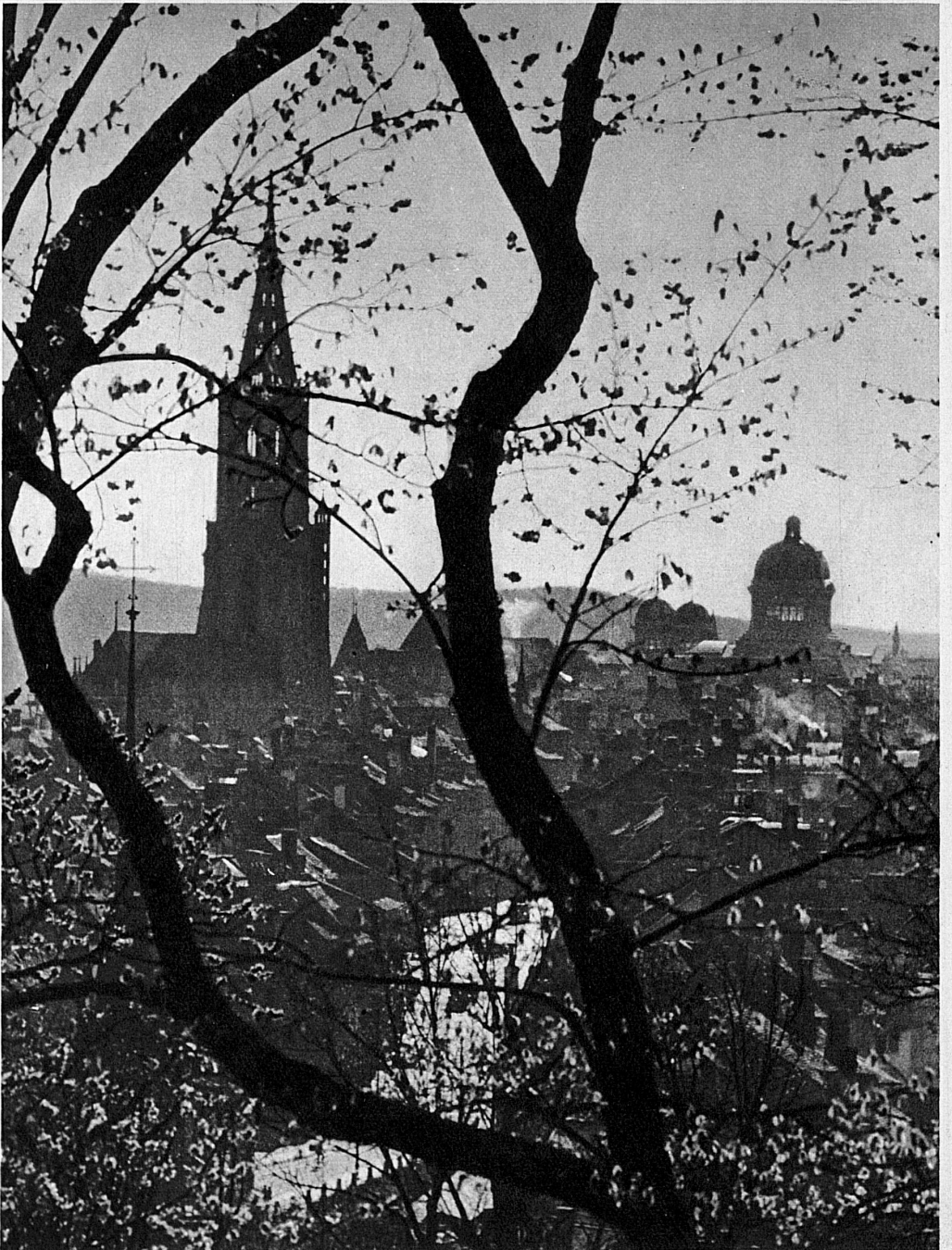
Spring at Berne: The Cathedral and the House of Parliament from the Aargauerstalden - Frühling in Bern: Die Altstadt, das Münster und das Bundeshaus vom Aargauerstalden aus gesehen - Printemps à Berne: La vieille ville, la cathédrale et le palais fédéral vus du Aargauerstalden