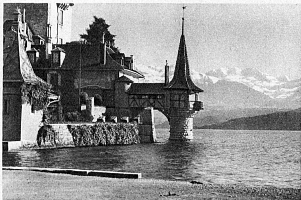
Schloss Oberhofen und die Blümlisalp — Oberhofen Castle and the Blümlisalp — Le château d'Oberhofen et la Blümlisalp