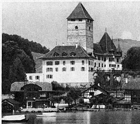
Schloss Spiez, historisches Museum — Spiez Castle, historical Museum — Le château de Spiez, musée historique