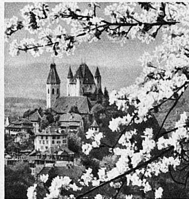
Schloss und Kirche von Thun — Thoune Castle and Church — Le château et l'église de Thoune