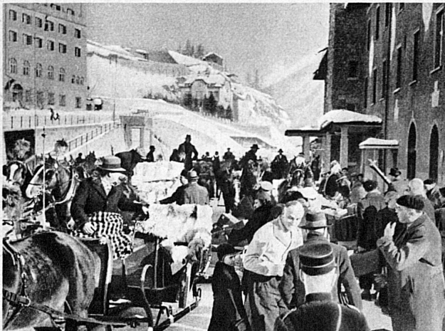
Hochbetrieb am Bahnhof St. Moritz – La Saison à St-Moritz, Engadine

Erste Landung eines Swissair-Grossflugzeuges auf dem neuen Flugplatz Samaden, Oberengadin. Im Hintergrund das Sportflugzeug des Segelfliegers Kronfeld – Premier atterrissage d'un avion Douglas de la Swissair sur le nouvel aéroport de Samaden dans la Haute-Engadine.