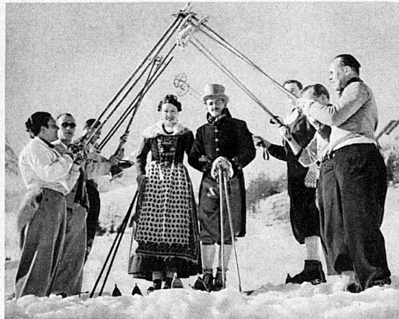
Skifahrerhochzeit in Pontresina. Das Paar, in der kleidsamen alten Engadinertracht, wird von den Sportlern im Skigelände empfangen – Mariage de skieurs à Pontresina. Le couple, paré de l'ancien et pittoresque costume de l'Engadine, est reçu par une sportive garde d'honneur en plein champ de neige