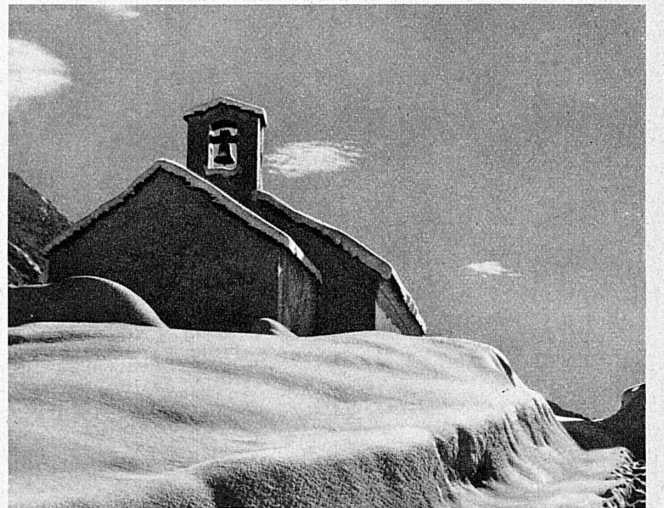
La chapelle de Pian San Giacomo — Die Kapelle von Pian San Giacomo