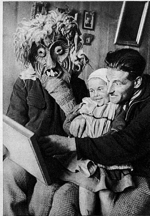
La tournée des masques se termine par une veillée — Zum Abschluss des «Tschäggätä»-Umganges finden die «Stubeten» statt