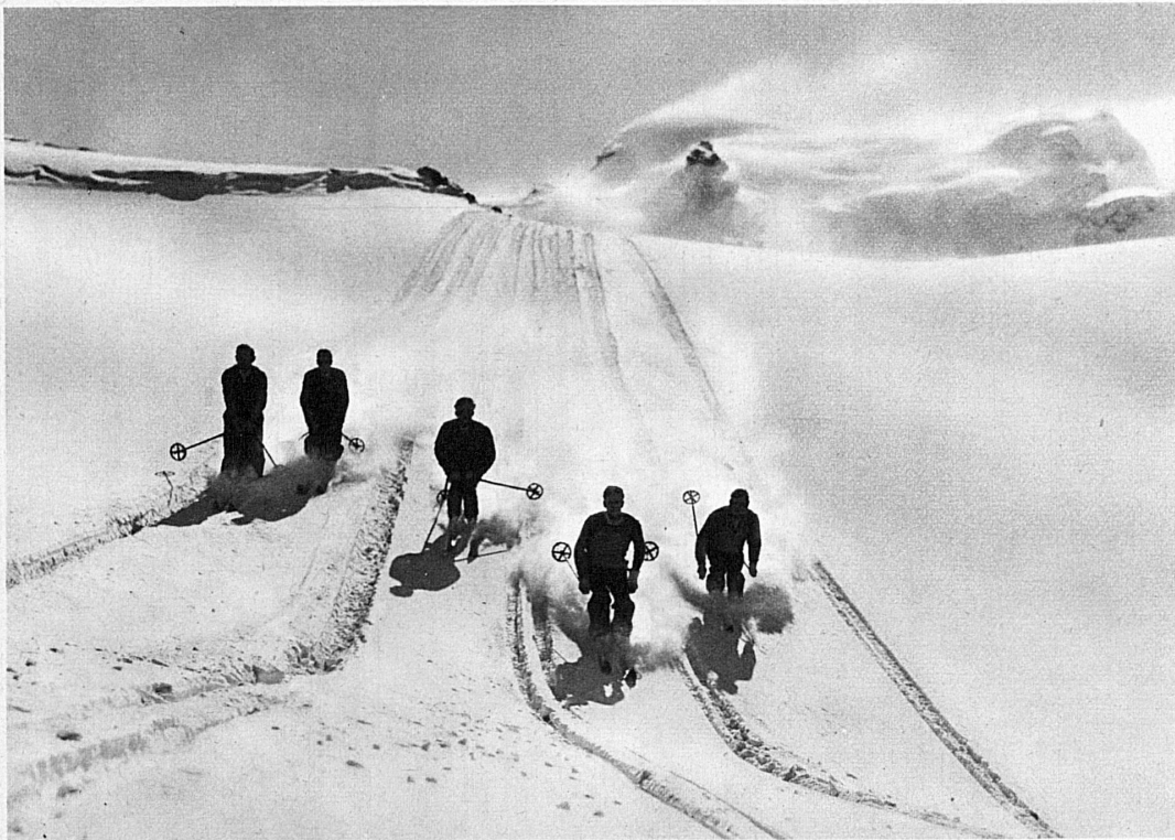
Rassige Abfahrt – La belle descente