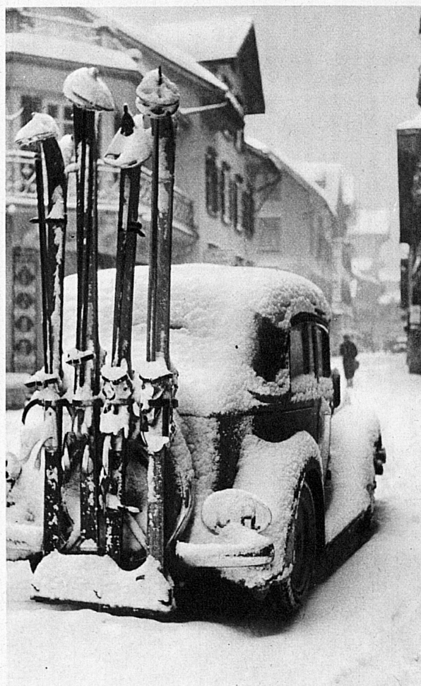
Engelberg ist auch im Winter mit dem Auto erreichbar - Même en hiver, Engelberg est accessible en auto

Le slalom ne sera pas moins intéressant. Le tracé commence à la Hegmatt, se poursuit sur un terrain aux pentes idéalement graduées, pour aboutir enfin à l'ancien tremplin de saut de Sandrain. Ici encore, le spectateur pourra très aisément suivre les évolutions des concurrents: à la Hegmatt même, mais surtout au haut de la pente dominant la forêt, et naturellement aussi sur les pentes inférieures, au pied desquelles il est possible de se rendre en traîneau.