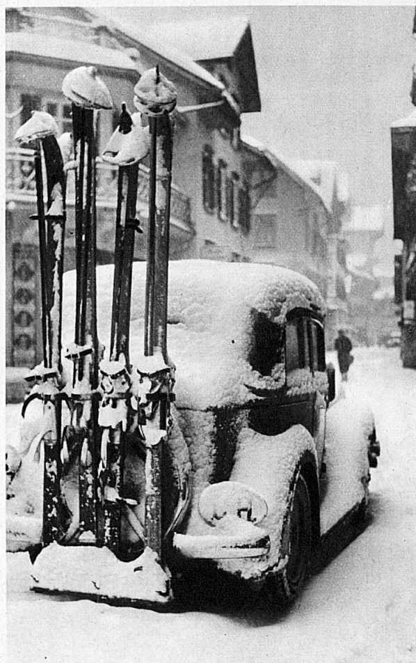
Engelberg ist auch im Winter mit dem Auto erreichbar - Même en hiver, Engelberg est accessible en auto

Le slalom ne sera pas moins intéressant. Le tracé commence à la Hegmatt, se poursuit sur un terrain aux pentes idéalement graduées, pour aboutir enfin à l'ancien tremplin de saut de Sandrain. Ici encore, le spectateur pourra très aisément suivre les évolutions des concurrents: à la Hegmatt même, mais surtout au haut de la pente dominant la forêt, et naturellement aussi sur les pentes inférieures, au pied desquelles il est possible de se rendre en traîneau.